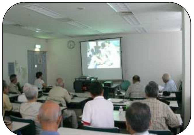
（例会でテレメ取材を合評する）