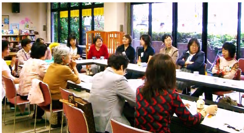
里親のほっとサロン(地域子ども家庭支援センターみなみ野にて)

「12月に八王子の里親が中心になって本を出すんですよ。タイトルは仮称『里親家庭によようこそ！』(明石書店 予価 1,470円)で、13家族の様々な喜怒哀楽の様子を綴っています。