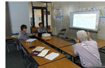
キックオフ資料作成でプロボノワーカーの熱い議論が展開されました