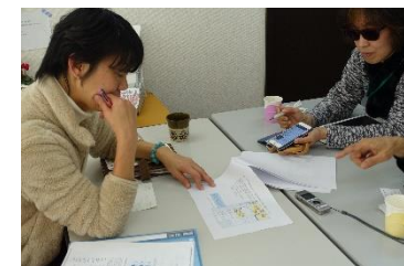
キックオフでの提案の様子です