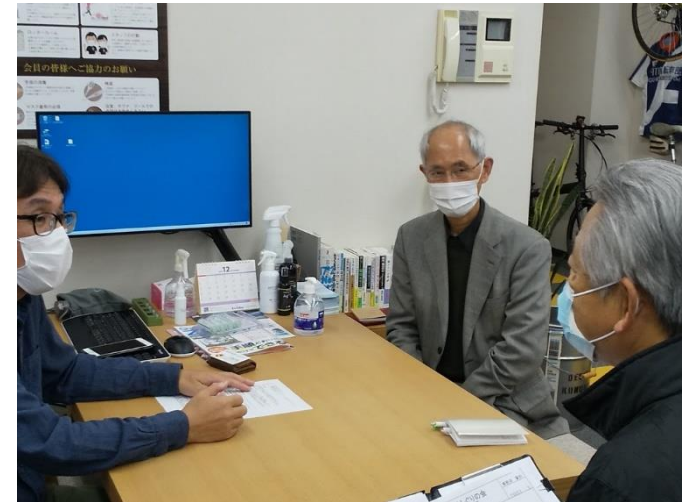
代表の他、1月23日には担当の方2名にも参加して頂けました