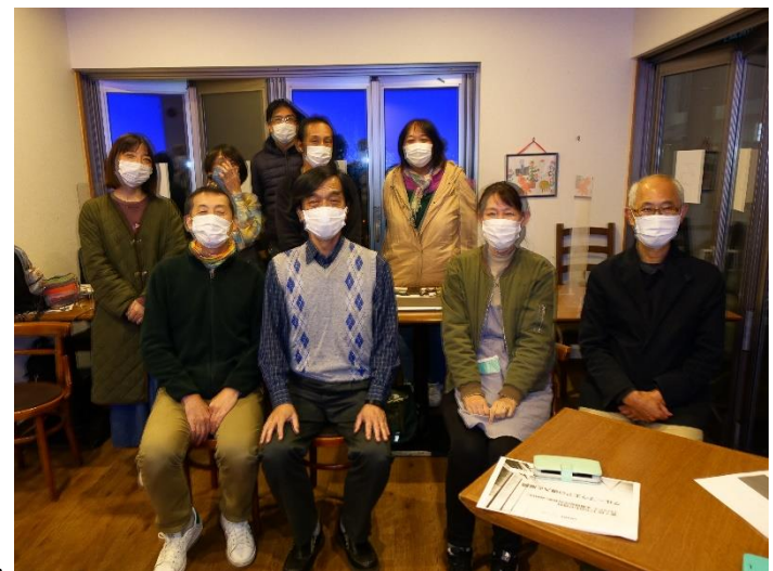
最終回は各事業所のコア・メンバー向けの講習会でした