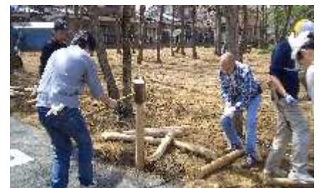
↑「手作り作業」の丸太柵づくり。近所のお父さん達が丸太の柵をたくさん打ち込んでくれました。いっしょに汗をかきました。