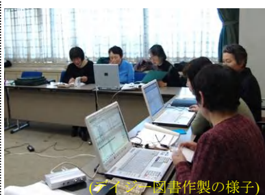
（デイジー図書作製の様子）

私どもの会「八王子朗読の会“灯”」は、目のご不自由な方の目の代わりをして30年になります。120名程の会員が、定期発行の読売ウィークリー・街かど・新聞・俳句の4誌、対面朗読（市内4図書館及び盲学校）、テープ図書、デイジー、校正、テープ管理の9部門で活動しています。