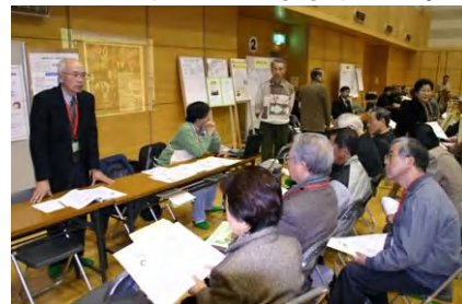
分野別の説明風景

お父さんお帰りなさいパーティーは主にシニアの方々の第二の人生を楽しく過ごすための一つの方法として、市民活動団体