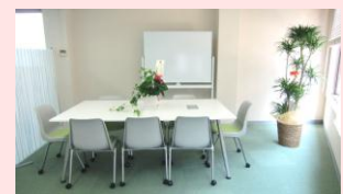
会議用に仕切られた6人~8人掛けのテーブルスペースです。