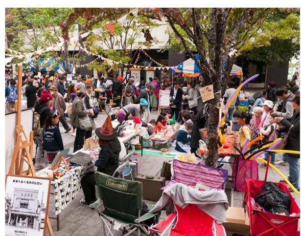
掲載した写真は過去の「みんなのキャンバス」の様子です

日時:10月28日(土)10:00~16:00 会場:セレオ八王子北館 ・9階イベントスペース・屋上 JR 八王子駅南口 ・サザンスカイタワー八王子1階東側広場 ・2階とちの木デッキ 主催:ファミリーフェス in はちおうじ “みんなのキャンバス”実行委員会 http://www.minnanocanvas.com/ (9月下旬オープン)