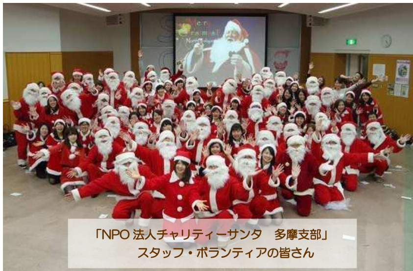
「NPO 法人チャリティーサンタ 多摩支部」 スタッフ・ボランティアの皆さん

❄️ 多摩支部では約 40 名のサンタクロース（ボランティア）やスタッフが活躍しています。学生だけでなく社会人、特に学生時代から引き続き活動を継続しているメンバーも多く、魅力ある活動を楽しんでいる様子が伝わってきました。 ❄️