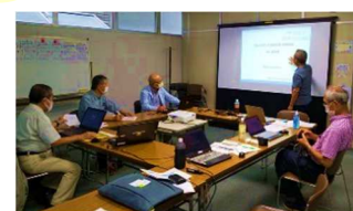
個別相談会の様子

前号で紹介した人財支援、プロボノによる「オンライン会議など遠隔でつながる方法」個別体験相談会は、好評につき6月21日、8月9日と2回開催しました。今後も随時開催予定です。