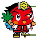
八王子の昔話を収録したオリジナル本『とんとんむかし』 揺籃社 2016