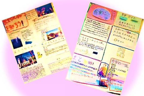
「出前語り」を聞いて小学生が作成した新聞

同会では幼稚園や保育所、小・中学校、高校、大学や高齢者施設にまで「出前語り」を行ってきました。印象的だったのは、素語りを聞いた小学 1 年生が「絵がないのに絵が浮かぶ」と言ってくれたこと。昔話に触発され「先生、絵を描きたい」という子もいて、子どもたちの情操教育の基礎を育てている様子うかがえます。さらに、「自分も語り部になりたい」という保育園児も現れ、2017 年には「子ども語り部笑学校」（年長児～小3）が誕生しました。