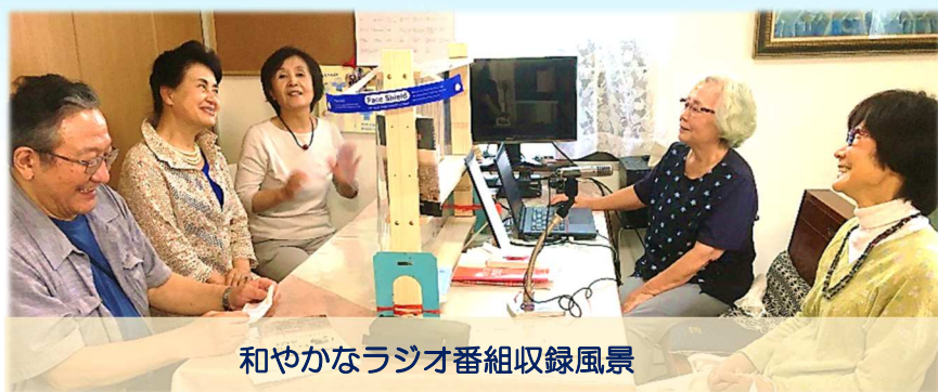
和やかなラジオ番組収録風景