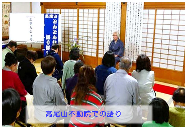
高尾山不動院での語り

日時：9月13日（日） 13:30～、14:30～ 各約20分 場所：高尾599ミュージアム（八王子市高尾町2435番3） http://www.takao599museum.jp/ 演目：「天狗の大岩かくし」「長寿の里」他