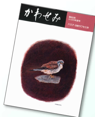
【写真右】会員向けに発行されている会報誌『かわせみ』