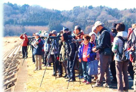
【写真左】野鳥観察会の様子

もう一つは、浅川流域で野鳥が安心して暮らせる環境をつくること。そのために野鳥の分布調査や羽数カウントなど、生態を記録し、その記録を冊子等にまとめて社会に発信しています。