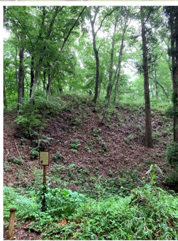
深い空堀と高い土の壁

滝山城は、戦国時代の1521年(大永元年)、八王子北部の加住丘陵の自然地形を利用して築城された中世城郭。「続日本100名城」にも選定され、今年築城500年をむかえます。今回は滝山城跡の発掘・復元を目指して活動するNPO法人「滝山城跡群・自然と歴史を守る会」を紹介します。