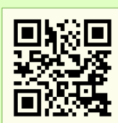
※こちらのQRコードからYouTube動画にリンクします