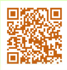
団体の今年度の活動予定