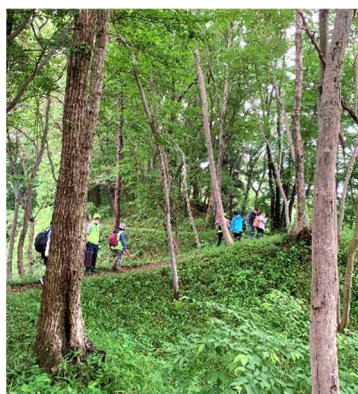
一列に進むしかない「土橋」