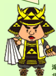
滝山城主 北条氏照