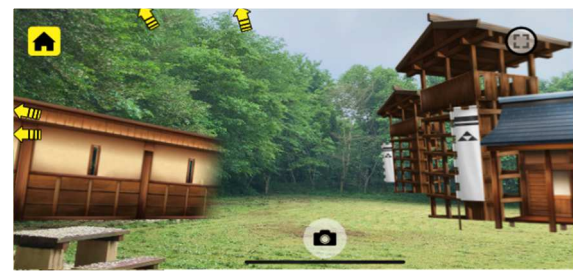
アプリを使って当時の様子を見ることができます