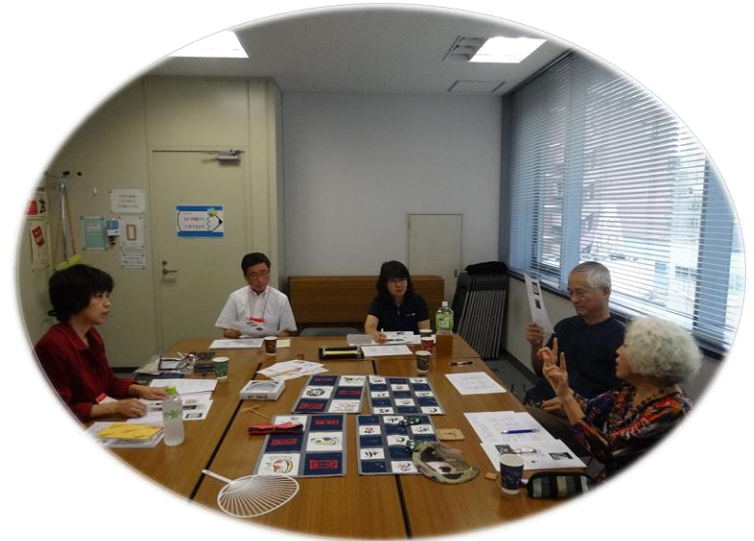
商品開発の検討の様子です

団体のミッション「知的障害・精神的障害を持っている方たちの支援を通し、障害をむしろ活かして、たくましく生きていく。共に生きる」をプロボノワーカー側が聞き出したことは大きな意義がありました。